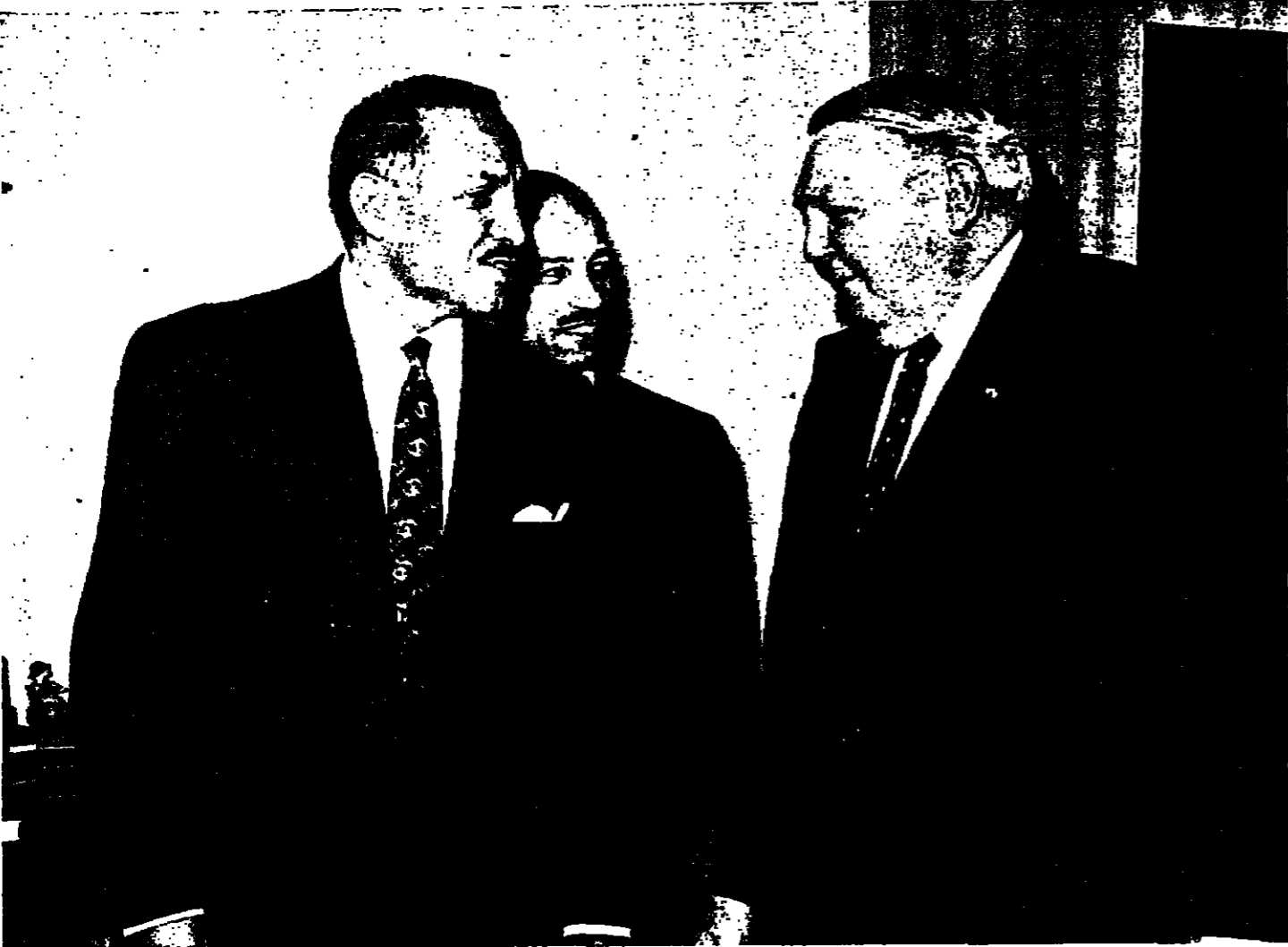
عبد اللطيف البغدادي عندما كان نائبا للرئيس جمال عبد الناصر، يستقبل إيرهارد المستشار السوفياتي لائتلاف الحرية